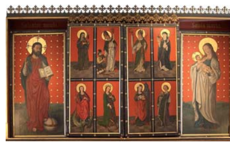
Fæststillingen. Fra Fæstelsesvending til og med Langfredag forberedes menigheden på Påsken, kirken største højtid. De 8 billeder viser Jesus lidelseshistorie. Vålbildet maler udførte billederne i 1480, sandsynligvis i 1. årbek. Her var der store værksteder, som fremstillede altertavler og anden kirkegul kunst. Vålbildet har signeret sit malen. Han har tillige udført altertavlen i Åhus Domkirke.

Jesus som vnderbender med venstre fod på jordkloden.