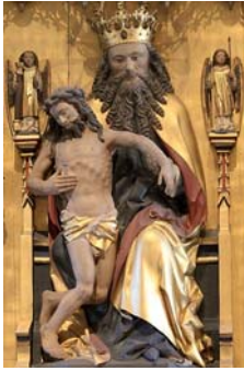
Altartavlen: Gud Vaker med den korsfæstede.