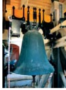
Kirken klædt er fra 1200-tallet og har ringet i 800 år.