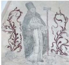
Kalkmaleri ved prædikestolen. Den hellige Antonius med sin lille gris, der bærer en bjælde. Han er grundlæggeren af klosterlivet. Først var han eneboer i Egyptens ørken i 300-tallet. Mange fremme slækte sig til hans og, der opstod et samfund af bellige mænd, der betragtes som de første munke. Antonius gris har givet navn til fin vinskæld fra Danske Slægtetier.