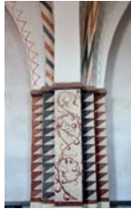
Søjle, der bærer ribbenene i hvælvene, set belyset ovenfor. Kalkmalerierne er fra 1510-20. Hvælvene er omfattet samtlige.