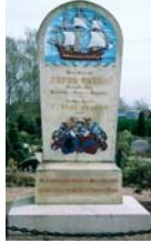
Mindesten for Peder Skram. Da familien Skrams gravkapel blev renoveret 1823, blev kisterne gravet ned på kirkegården. Stenen rejstes af Højrefolk i 1886.