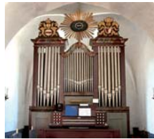
Ogelfocaden er fra 1775, men oglef er formet flere gange, senest 2004. I smalkransen står Jalve på hebræisk.