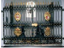
Smedejernspjættet foran Grabows kapel er fra 1768. Denne familie ejede Østbirk Kirke og herregården Urup i 1700-tallet. Fem næsten ens sørdøgn står i kapellet.