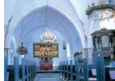
Kiferamet set mod alteret, fotohimmelen over døbefonten, prædikestolen og hykonerne. Loftet udgøres af 6 gotiske hvælvinger, båret af søjler langs væggen. På ribbenne kalkmalerier.