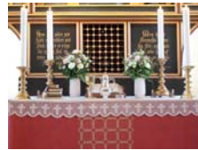
På alterbordet står Peder Skrams malerstykker med lovefædder fra 1577, altretavle, vindskæle og patene (beholder til altretavle).